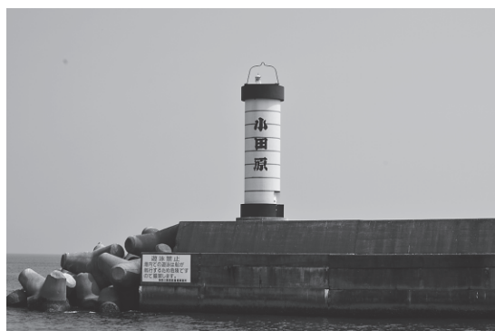
小田原港二号防波堤灯台（神奈川県）