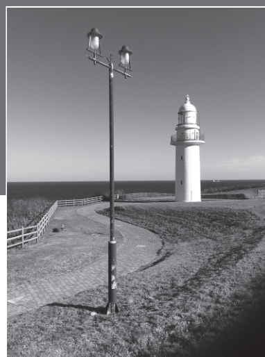
恵山岬灯台（北海道）